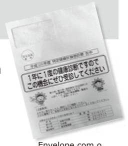
Envelope com o formulário de exame