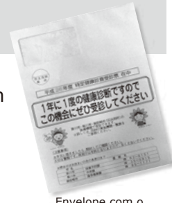
Envelope com o formulário de exame

(国民健康保険加入の40~74歳のみなさんへ~特定健診を受けましょう!) Informações: Hoken Zukuri-ka (☎62-6151)