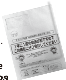
Envelope com o formulário de exame