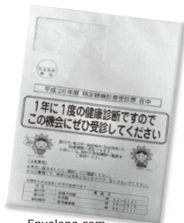
Envelope com o formulário de exame